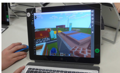
図 1 マイクラフトの画面

マイクラフト(図 1)は、子供達に人気のシミュレーションゲームソフトである。立方体の様々なブロックを利用し、建物や町並みを作っていくことができ、ネット上には、凄いといふ言いのない立体物を長時間かけて作成した作品が多くアップロードされている。