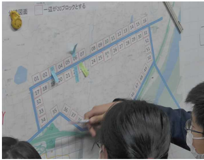
図3 新しく作る町の方譲地図