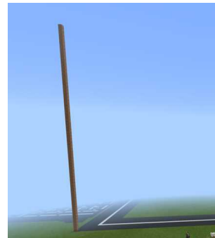
図6 指標となる鉄塔

渡せないため、建築物を見失ってしまうことがある。それを知ったある子は図6のように道路の分岐点に目印となる高い鉄塔を建て、みんなが指標として使えるように工夫した。