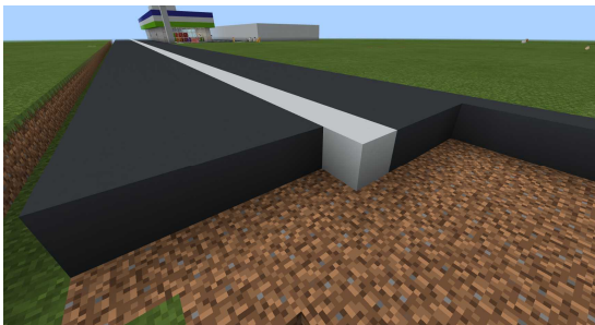
図4 道路の舗装作業

そこで、子供達から「こういう作業こそロボットにまかせることができるのではないか」という声があがり、何人かで挑戦しはじめた。