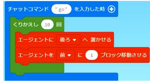
図5 道路の舗装のためのコード